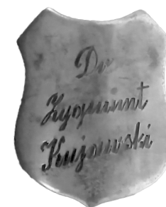
Gwóźdź Pamięci „Broma” w Sztandarze Szkoły

Na rok przed śmiercią był w naszej szkole na uroczystości nadania imienia Powstańców Warszawy. „Brom” jest Patronem sali nr 3.